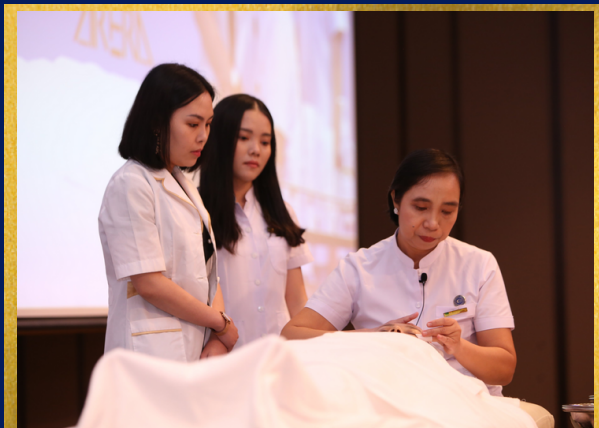
SPA & Business Owners

At Vo Dung, we offer courses for 2 main subjects: