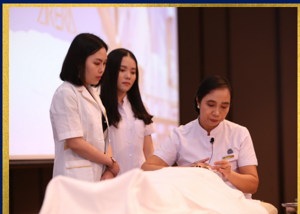
Chủ SPA & Doanh nghiệp